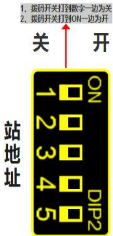
站地址拨码对应JY-MODBUS模块站号表（1-31）

修改站号的范围在 1~32，必须通过调整模块上“站地址”拨码开关的状态设置，注意当模块上电时调整拨码状态时，需将模块断电至少 3S，再上电方可生效。具体对应关系如下表中所示（出厂时所有拨码为 OFF）。