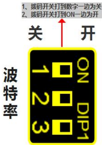
波特率拨码对应串口波特率对应表

RS485 接口的波特率由模块上的“波特率”拨码开关状态决定，注意当模块上电时调整拨码状态时，需将模块断电至少 3S，再上电方可生效。具体关系可见下表（出厂时所有拨码为 OFF）。